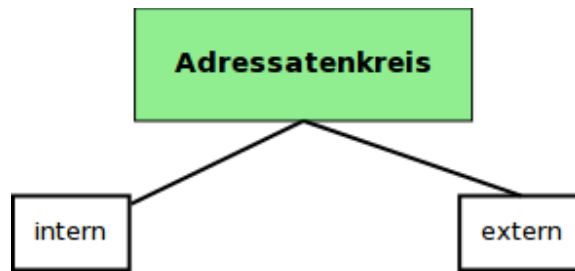
Abbildung 2: Berichtsarten nach [Jon09]

Es gibt verschiedene Arten von Berichten, die in zwei Gruppen eingeteilt werden können. Man unterscheidet dann zwischen internen und externen Berichten und haben neben den, in Abschnitt 2 vorgestellten Einsatzzwecken, auch eine eine anderen Aufbau und Strukturierung. Je nach Adressat werd Informationen vorenthalten oder eben anderst dargestellt. Ausgehend vom Adressatenkreis (siehe Abb. 2), kann in die nun folgenden Berichtstypen unterteilt werden.