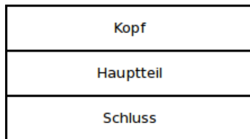
Abbildung 3: Berichtsrahmen [Jon09]

Der Aufbau eines Berichtes ist abhängig von seiner Art, aber generell betrachtet, kann die wie in Abb. 3 gezeigte Struktur übernommen werden. Die Informationen die im Kopf des Berichtes vorkommen sollten die folgenden Fragen beantworten: “ Wer? Was? Wo? Wann? ”. Im Hauptteil muss zunächst die Ausgangslage geklärt werden und was die derzeitige Situation ist und was ist die Folgerung daraus. Wie bereits erwähnt ist die Strukturierung abhängig von der Art des Berichtes. Wichtig ist jedoch immer die chronologische Reihenfolge der Geschehnisse. Zum Abschluss des Berichts müssen noch ein paar Formalien erfüllt werden, so folgt auf dem Hauptteil zum Beispiel eine Verabschiedung, oder Verweise auf weitere Informationen.