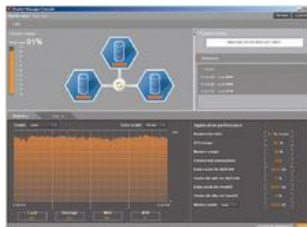
Abbildung 3: Im Unterschied zum MySQL-Cluster bietet das Produkt von EAC dem Anwender eine grafische Oberfläche für viele Administrationsaufgaben.

Jeder Node lässt sich einzeln administrieren, die entsprechenden Kommandos übermittelt ein Mausklick. Dies gilt allerdings nur für Cluster-Kommandos, den lokalen MySQL-Server auf dem Node muss der Admin weiterhin auf einem anderen Weg verwalten. Das Tool bietet auch die Möglichkeit, Statistiken als fortlaufende Graphen anzuzeigen und die Logdateien einzusehen. Dabei stellt es unter anderem die Last, die Antwortzeiten oder den Durchsatz dar. Alle Funktionen der grafischen Oberfläche - außer der Statistik - sind auch über ein Kommandozeilen-Tool erreichbar.